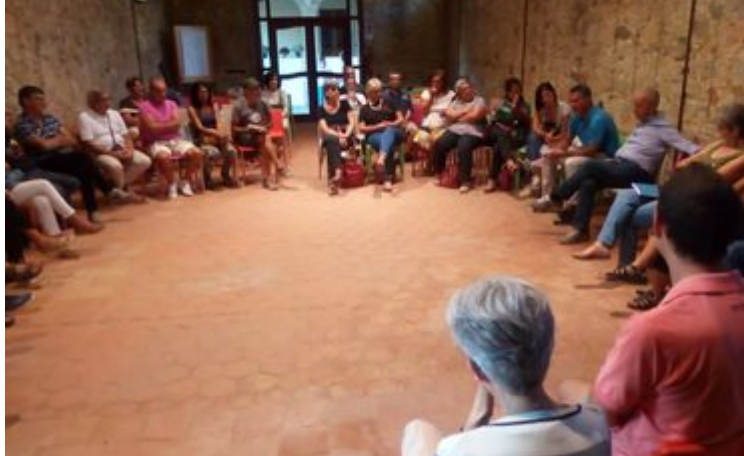
Tavola rotonda con cittadini e amministrazione sui temi di ambiente e stop plastica

28 SETTEMBRE A SETTIMO SAN PIETRO, COMUNE RE.CO.SOL, INCONTRO SULL'INIZIATIVA #SARDEGNAPLASTICFREE